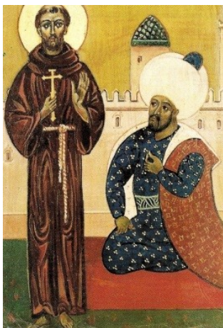
saint François d'Assise et le sultan Malik Al-Kamil