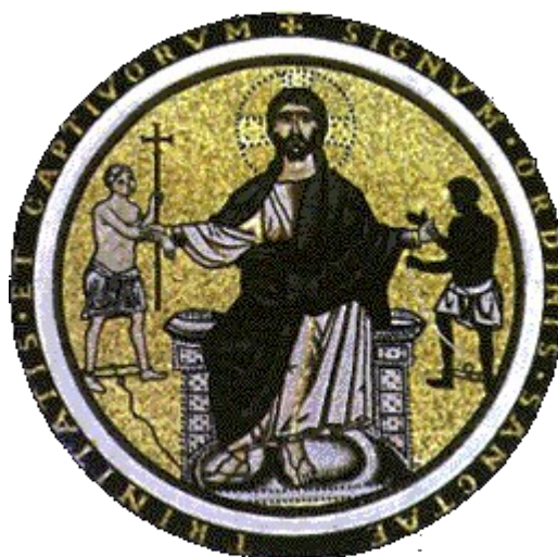
Jésus libère les captifs

Que dit l'islam ? « Interrogez les juifs et les chrétiens si vous ne savez pas »